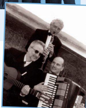
TRIO MANTEI, BRAUN UND HARTMANN